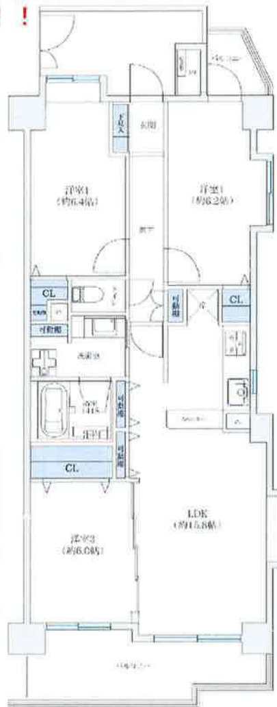
※図面と現況が異なる場合は現況を優先とします。