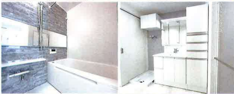
室内フルリフォーム工事実施